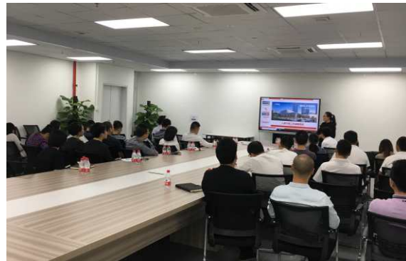
(人资行政工作流程培训)