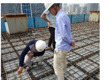
（T3八层空心楼板浇筑前验收）