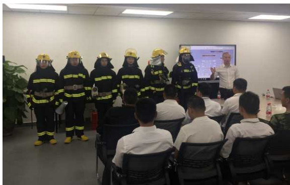
(安全生产管理培训)