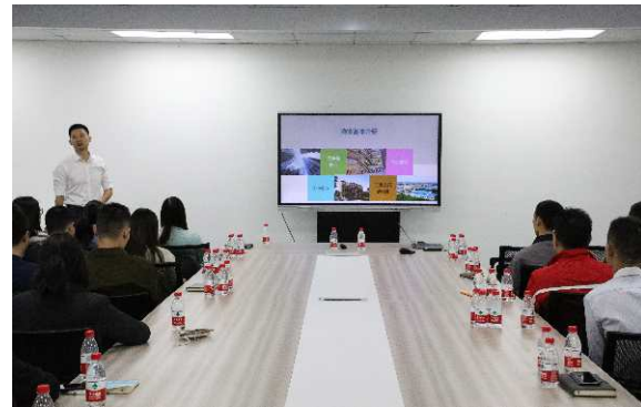
(工程设备设施知识培训)