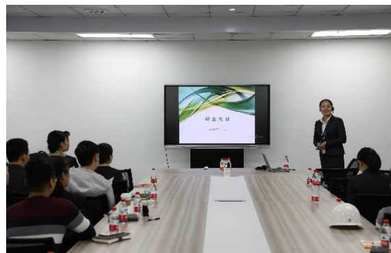
(职业礼仪培训照片)